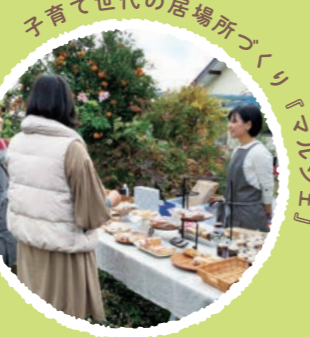
子育て世代の居場所づくり『マルシェ』

子育て世代と色々な世代が繋がり、子どもたちや自然、町を育て、互いを思いやる気持ちも育めるといいですね。