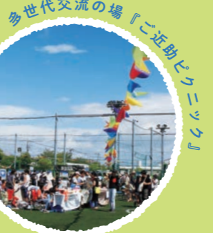
多世代交流の場『ご近助ピクニック』