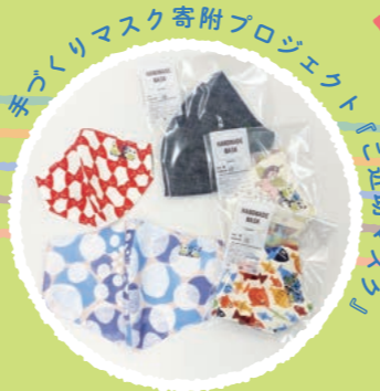
手作りマスク寄附プロジェクト『ご近助マスク』