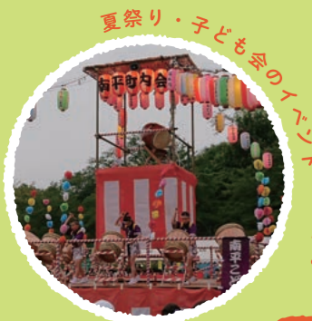
夏祭り・子ども会のイベント