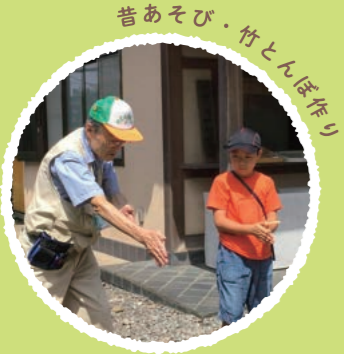
昔あそび・竹とんぼ作り