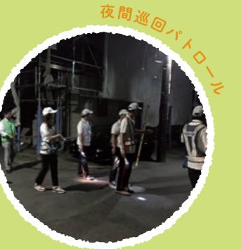
夜間巡回パトロール

夜間も巡回してパトロールを実施しています。 地域で見守ることで、子どもたちが安心し、 ほっとしてもらえるように活動しています。