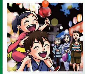
まちのイベントに さん 参加