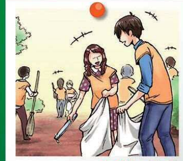
ボランティア活動に さん 参加

ち い き 地域 の つ な が り ・ 支 え 合 い の し く み = 地 域 包 括 ケ ア シ ス テ ム